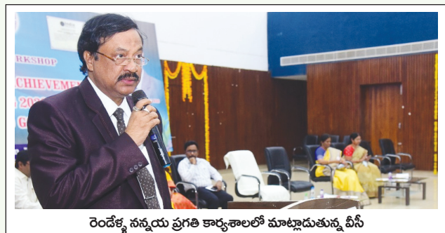
రెండేళ్ళ నన్నయ ప్రగతి కార్యశాలలో మాట్లాడుతున్న వీసీ

కోట్లకు పైగా ఖోలో నిధులు క్రీడాభివృద్ధికి కేటాయించడం జరిగిందన్నారు. విశ్వవిద్యాలయాల చరిత్రలో విశ్వవిద్యాలయ స్థాయి తొలి తెలుగు వారపత్రికగా అధికవి నన్నయ విశ్వవిద్యాలయం నుండి "నన్నయవాణి" పేరుతో ప్రతి సోమవారం విశ్వవిద్యాలయ పత్రిక విడుదల అవుతుందన్నారు.