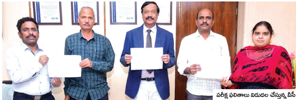
పరీక్ష ఫలితాలు విడుదల చేస్తున్న వీసీ