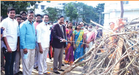
భోగిమంటను వెలిగించి సంబరాలను ప్రారంభించిన వీసీ